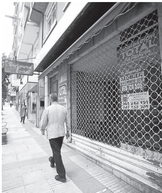
Un negocio cerrado en la avenida de Os Mallos

Ahora, con las obras, Salgado relata que “hay comercios que abren y no entra nadie a comprar se desaniman. Igual algunos más, cuando pasen las obras, se plan-