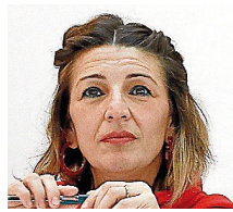
Yolanda Díaz Diputada Unidas Podemos

No valoró el polémico tuit de Xosé Manuel Beiras sobre el origen del término Compostela, pero dijo que "la ciudadanía en democracia vota lo que estima y hay que respetar democráticamente a todo el mundo".