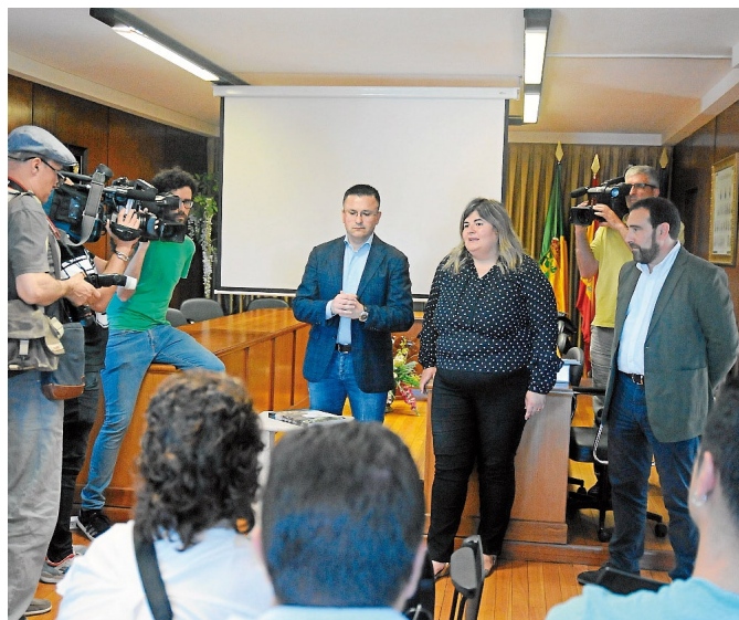
José González con representantes de las parroquias de Albarellos y Xurenzás.

El conselleiro explicó ayer en su visita a dicho concello ourensano que la Xunta va a actuar este año en 68 parroquias de 34 concellos del mapa gallego en cerca de 700 aldeas que fueron elegidas y priorizadas en función de la actividad incendiaria, de acuerdo a unos criterios objetivos, relacionados con la virulencia de los fuegos, la