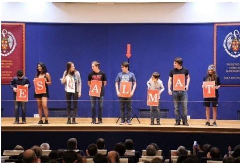
Celebración del XX aniversario de ESTALMAT- Comunidad de Madrid.