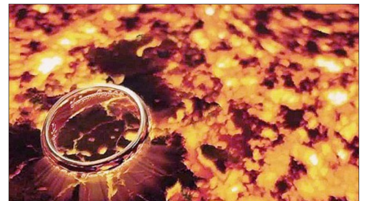
La imagen del Monte del Destino está basada en ecuaciones