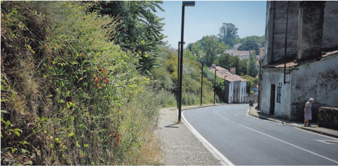
Una calle donde la maleza invade las aceras, en la zona de Carme de Abaixo, en el centro de Santiago.