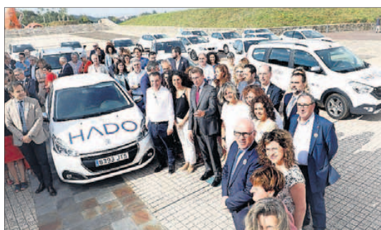
Presentación del plan Hado 2019-2021.

Un congreso del 22 al 24 en Santiago acogerá la presentación de los trabajos de varios matemáticos gallegos que avanzan en la optimización del diseño de carreteras y vías férreas para reducir costes económicos y ambientales. El Congreso sobre Transferencia entre Matemáticas e Industria lo promueve el Instituto Tecnológico de Matemática Industrial y participado por las tres universidades gallegas.